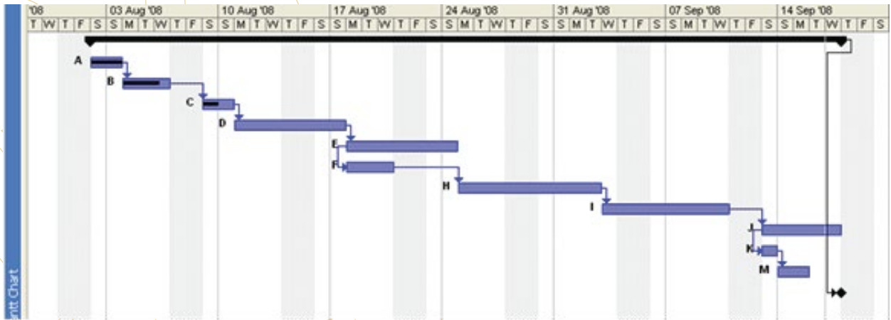
2. Gantt Chart

بعد ذلك استعرض المدرب تطوير جدولة المشروع لكل مجموعة من مجموعات العمل.